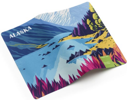
Ansicht des fertigen Displaytuchs